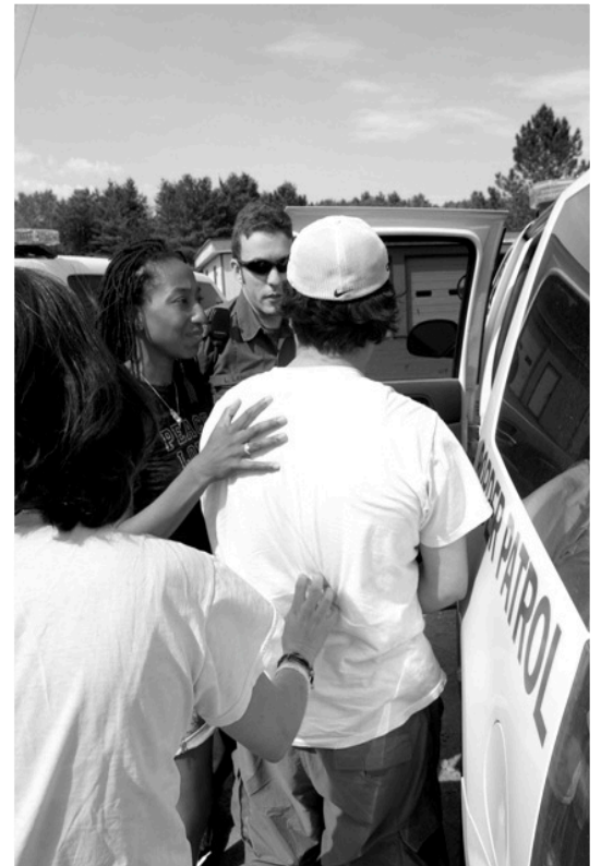
La migra me arresta

Más tarde llegaron los agentes de migración donde nos interrogaron para luego trasladarnos a la base de migración, para nuestra sorpresa afuera de la estación estaban amigos que son aliados del JUSTICIA MIGRANTE (vtmfsp).