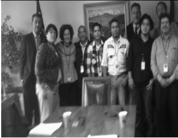
Justicia Migrante con el gobernador