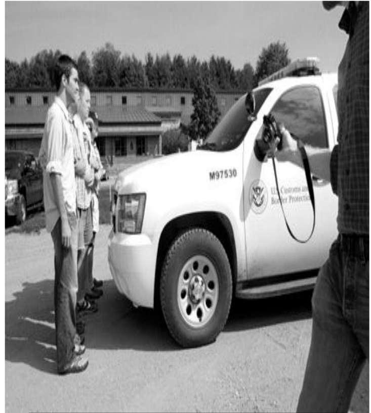
Aliados de Justicia Migrante bloquean la migra para detener la detención nuestra. 3 fueron arrestados.

Después de lo sucedido nuestro caso fue muy publicado por periódicos, televisión y radio. Después entre los compas se hizo un pliego de peticiones donde pedíamos cambios en Vermont para que tengamos una vida mejor.