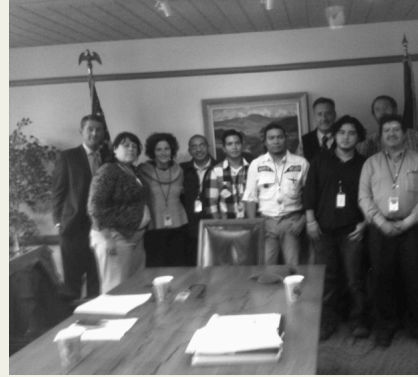
Justicia Migrante con el Gobernador

El 14 de octubre del 2011 se tuvo una reunión con el gobernador de el estado de Vermont donde participo un grupo de compas migrantes en representación de todos los que no pueden asistir por la dificultad de nuestros trabajos.