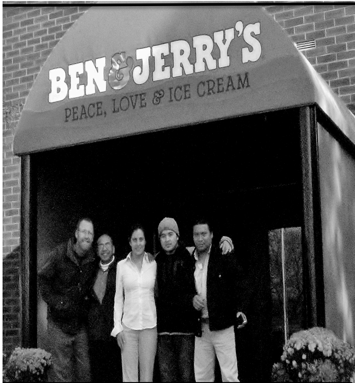
Justicia Migrante Al frente de Ben & Jerry's

TU PATRON LE VENDE A ST. ALBANS COOP? LLAMANOS Y PARTICIPA!