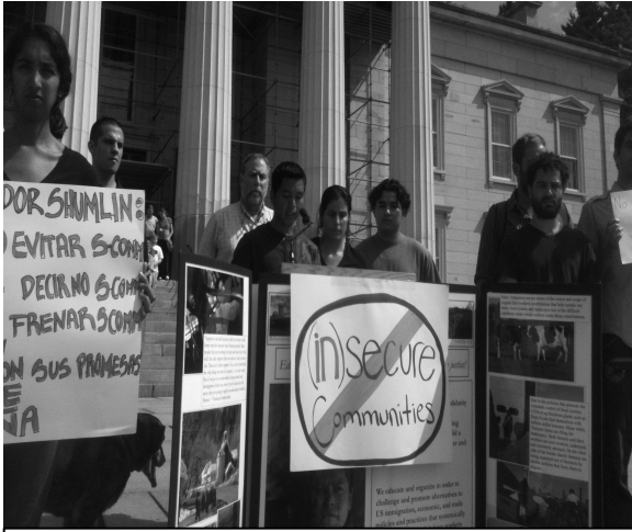
Foto de la Rueda de Prensa

El 18 de agosto del 2011 realizamos una rueda de prensa en la cual hablamos del problema que traen los programas federales como Comunidades (In)seguras y el miedo que hay en nuestra comunidad por culpa de la Polimigra.