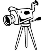
CAMARAS DE VIDEO